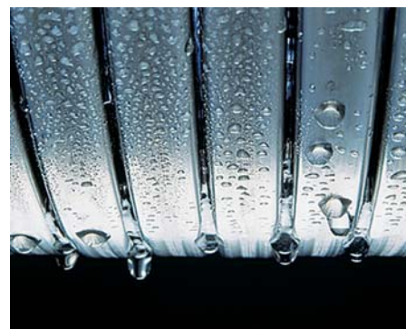
Suprafețe de transfer termic Inox-Radial

Acesta conține componentele de circulație a apei cum ar fi pompa de circulație sau vana de amestec. Pentru dvs. aceasta înseamnă o economie de timp în întreținere sau în caz de intervenție asupra cazanului.