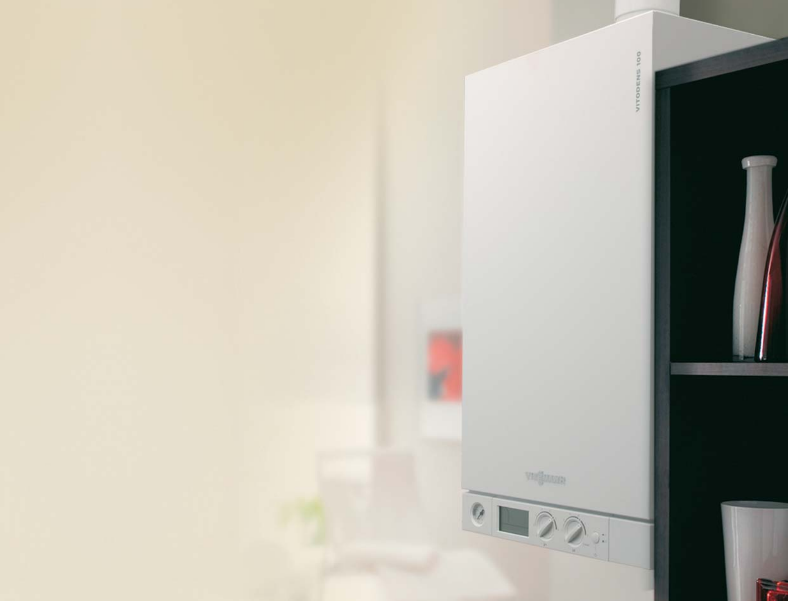
Vitodens 100-W Cazan mural în condensare pe combustibil gazos