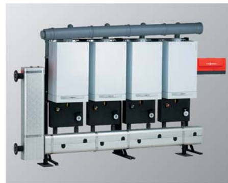
Ramă de montaj în cascadă (în linie)

Automatizarea Vitotronic 300-K permite legarea în cascadă a până la patru cazane Vitodens într-un singur ansamblu de încălzire. În această situație puterea cazanelor se adaptează automat necesarului de căldură, putând fi astfel în funcțiune numai unul sau toate cele patru cazane.