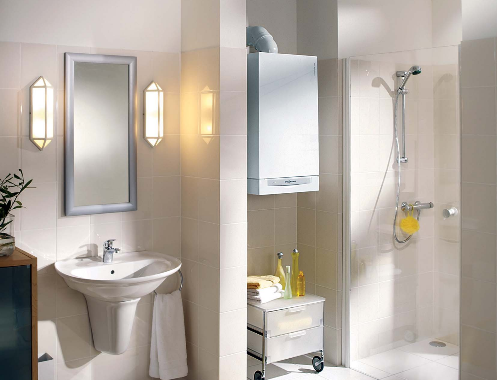
Vitodens 200-W Cazan mural în condensare pe combustibil gazos