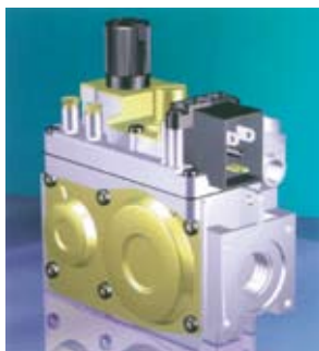
La valvola gas elettrica è provvista di due sicurezze

The electric gas valve is supplied with two security devices