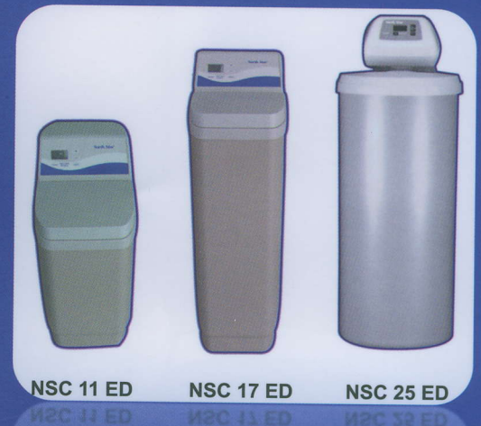
NSC 11 ED